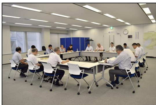
◆写真 A：職場環境改善検討会開催状況