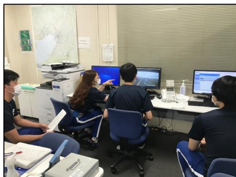
◆写真 C：KYT 開催状況