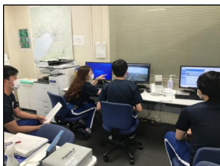
◆写真 C：KYT 開催状況