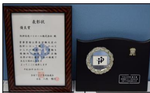
◆全国 T H P 推進協議会表彰